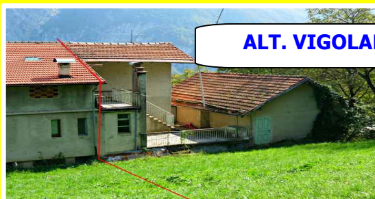
ALT. VIGOLANA Rif. 192

In frazione ben servita, intera porzione terra-tetto da ristrutturare con due appartamenti al primo piano, un appartamento al secondo piano, soffitta, garage di 30 mq, cantine, cortile e giardino di 500 mq.