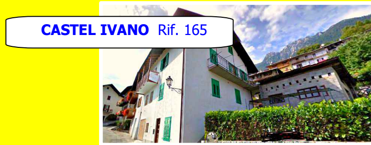
CASTEL IVANO Rif. 165

Nelle vicinanze di Strigno, intera porzione di casa con cantine a piano terra, appartamento di 55 mq al piano primo, alloggio con mansarda al piano secondo, soffitta, giardino privato di 250 mq e deposito esterno.