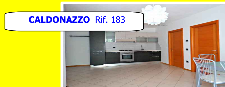
CALDONAZZO Rif. 183

Posizione comoda, su palazzina di recente costruzione, appartamento al primo piano con ingresso, ampia zona giorno, due camere da letto, bagno, due poggiali, garage di 23 mq e cantina. Riscaldamento a pavimento. Subito disponibile.