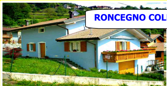
RONCEGNO COLLINA Rif. 085

Posizione panoramica e molto soleggiata, graziosa villetta singola di recente costruzione e di modeste dimensioni. Con tre camere da letto, due poggiali, doppi servizi, ampio garage, cantina e giardino di 447 mq. Ottime finiture.