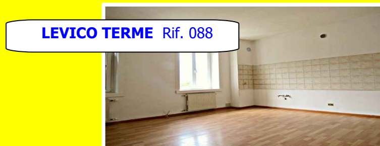
LEVICO TERME Rif. 088

Su piccola palazzina posta in posizione centrale, appartamento di 90 mq al secondo piano. Con ingresso, soggiorno, cucina a vista, tre camere da letto, bagno e cantina. Termoautonomo a metano. Parzialmente da rimodernare.