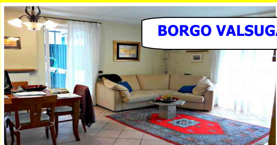
BORGO VALSUGANA Rif. 147

Zona residenziale comoda ai servizi, curato appartamento sito al primo piano. Con ingresso, cucinino, salotto, due camere, terrazzo di 9 mq, due poggiali, posto auto esterno e garage per due automobili. Viene venduto arredato. Ottima occasione.