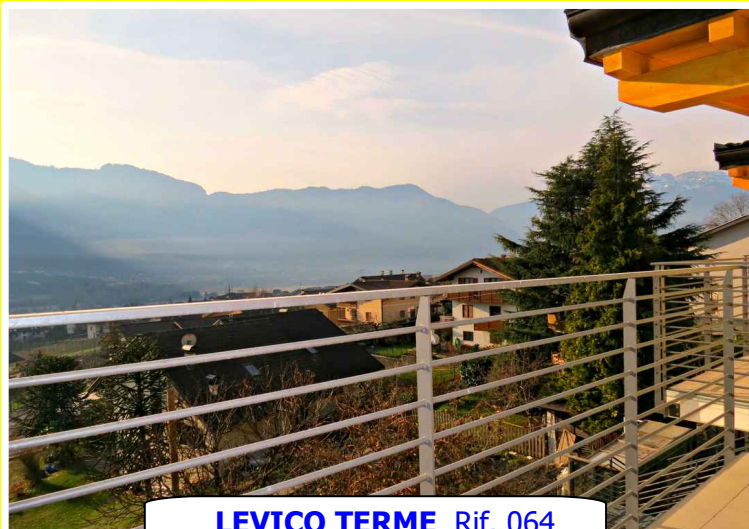
LEVICO TERME Rif. 064

Tranquilla zona residenziale, su palazzina ultimata nel 2014, accogliente appartamento di 85 mq posto al secondo piano. Con ampio terrazzo d'ingresso, soggiorno, cucina a vista, due camere da letto, due poggiali e bagno con finestra. Completo di garage e cantina. Spese condominiali contenute.