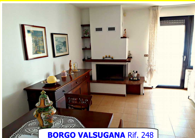
BORGO VALSUGANA Rif. 248

Zona Valli, in comodo villaggio residenziale dotato di ampio spazio uso parcheggio e area verde ideale per i bambini, villetta a schiera disposta su tre livelli. La casa è stata costruita negli anni '80 ma si trova in buone condizioni ed ha una bella vista e un'ottima esposizione.