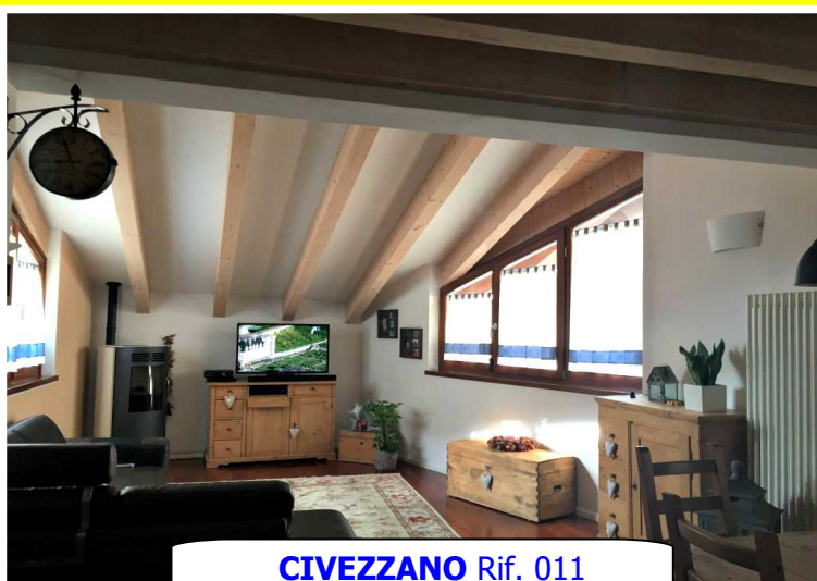
CIVEZZANO Rif. 011

In palazzina con quattro unità, elegante appartamento su due livelli con ingresso, accogliente zona giorno di 42 mq, disimpegno e bagno al piano principale, camera da letto matrimoniale, camera doppia, disimpegno e secondo servizio al livello superiore. Con cantina di 13 mq .