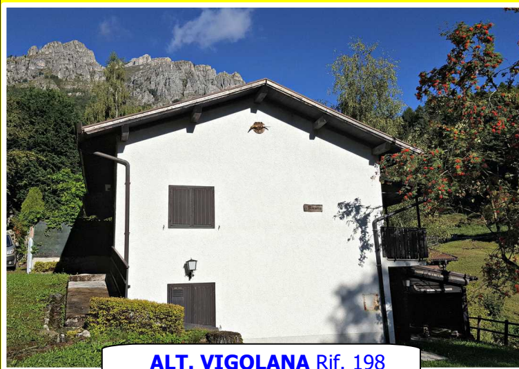
ALT. VIGOLANA Rif. 198