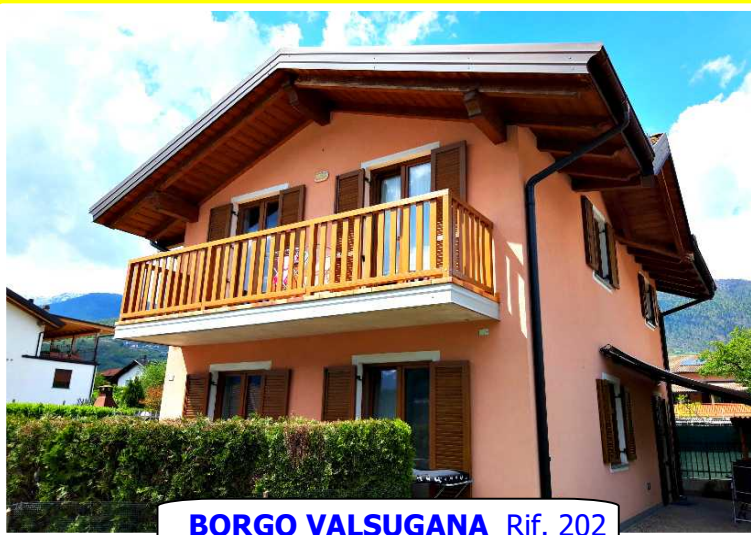
BORGO VALSUGANA Rif. 202